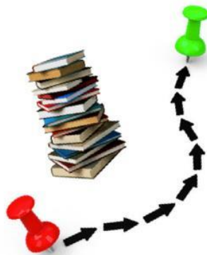
Abb. 1: Deckblatt

Anja Eichhorn/Kerstin König Freie Oberschule Gohlis Fach Deutsch Schuljahr 2020/2021